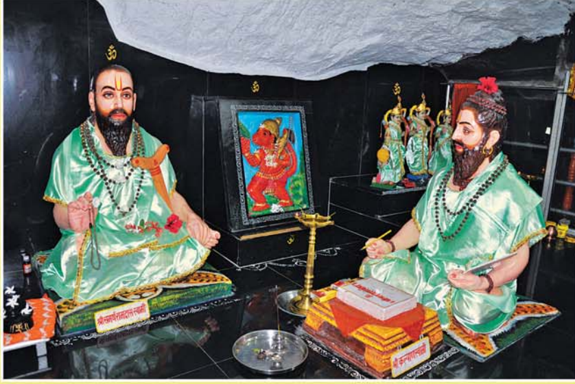
शिवथरघळीतील मूर्ती - श्री सुंदरमठातील दासबोध लेखन